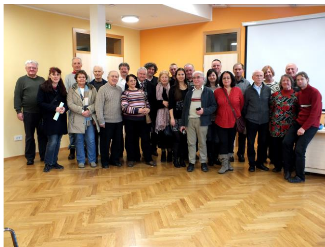
Skupna slika udeležencev Zamenhofovega dne v Mariboru