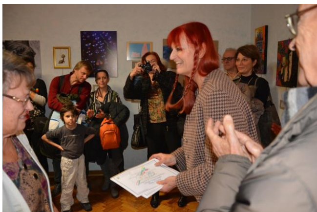
Mentorica prejema diplomo iz rok predsednice TEA