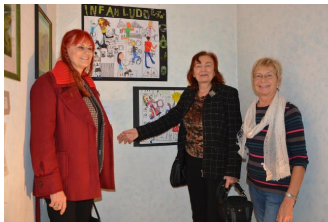
Razstavljeni plakati kranjskih učencev