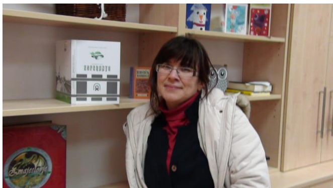
Učbenik esperanta v knjižnici Pekre pri Mariboru