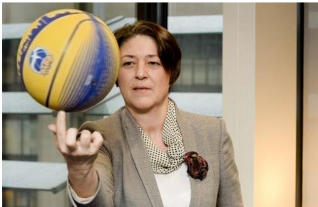
Biciklistoj havas esperojn en Violeta Bulc, la nova eŭropa komisionanino pri transporto

Komisionanino pri transporto Bulc, biciklante de sia oficejo en la Komisiono ĝis la Eŭropa Parlamento, jam ricevis favorajn komentojn. Laŭ la germana verdulo Michael Cramer la kvinminuta biciklado estas eĉ »malgranda akto de politika kuraĝo«. Bulc promesis al la parlamentanoj, ke ŝi trovos la justan lokon por biciklada politiko.