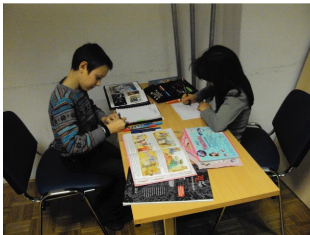
Mladi – prihodnost esperantskega gibanja

Priporoĉamo se za prispēvke o vaŝi dejavnosti, predloge in kritike, fotografije in opaŝanja, ki bi utegnila zanimati tudi druge. O.K.