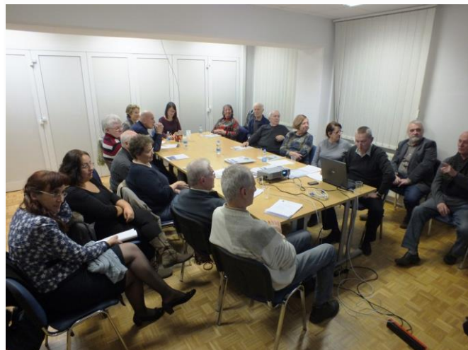
Skupščina društva med zasedanjem

lingvo.info . Novembra je izšla druga letošnja številka glasila Espero – november . Društvo je v začetku leta 2014 začelo z začetnim tečajem esperanta za občane Maribora. Tečaja se je udeležilo dvanajst udeležencev, končali so ga štirje. Med letom so potekala Srečanja z literaturo , katerih se je udeleževalo pet članov društva. V jeseni 2014 so začeli z nadaljevalnim tečajem esperanta za udeležence pomladnega začetnega tečaja.