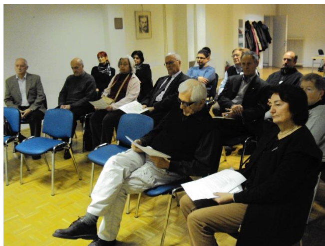
Slavnostni del proslave Zamenhofovega dne