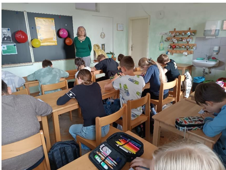
Waldorfa elementa lernejo en Naklo ĉiam gastigas prelegojn pri Esperanto